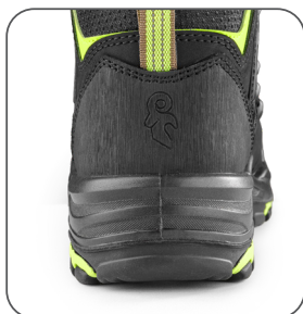
odolná pätná časť odolná päťová časť resistant heel part wytrzymała część pięty