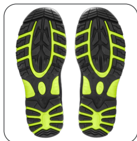
podešev podošva outsole podeszwa