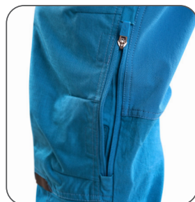
kolenní kapsy s boční ventilací a možností vložení kolenních výztuh kolenné vrecká s bočnou ventiláciou a možnosťou vloženia kolenných výstuh knee pockets with side ventilation and possibility to insert knee pads kieszenie na kolanach z bočną wentylacją i możliwością włożenia nakolanników