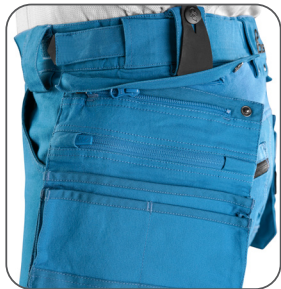
odepínací kapsy odnímateľné vrecká detachable pockets odpinane kieszenie