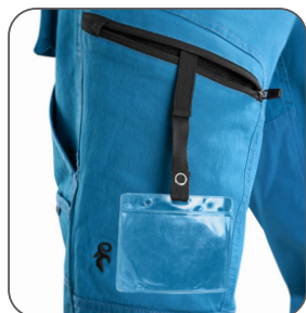
stehenní kapsa s vnitřním pouzdem na ID kartu stehenné vrecko s vnútorným pouzdom na ID kartu thigh pocket with inner ID card holder kieszeń na udzie z miejscem na ID kartę