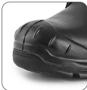
zesílená predná časť proti okopu vonkajšia ochrana špičky reinforced PU overcap nosek z PU wzmocnieniem