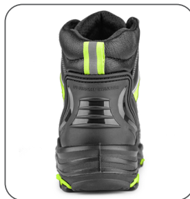
TPU ochrana paty TPU ochrana päty TPU heel protection TPU napiętek ochronny