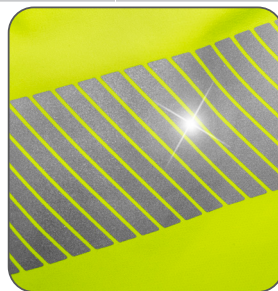
segmentované reflexní pruhy segmentované reflexné pruhy segmented reflective prints segmentowane taśmy odblaskowe