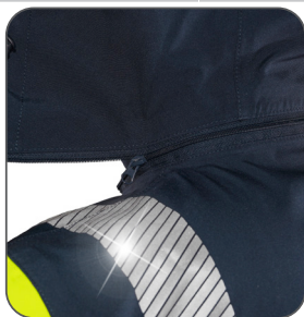
odnímatelná kapuce odnímatelná kapučňa detachable hood odpinany kaptur