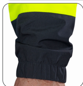
pružné manžety rukávů elastické manžety rukávov elastic sleeve hems elastyczne mankiety rękawów