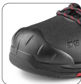
zesílená přední část proti okopu vonkajšia ochrana špičky reinforced PU overcap nosek z PU wzmocnieniem