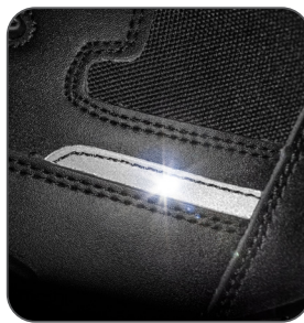
detail reflexního pásku detail reflexného pásika reflective strip detail detal odblaskowego paska