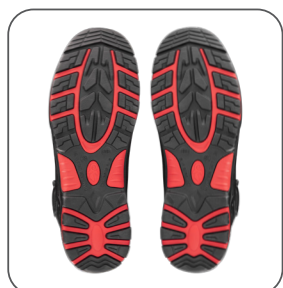
podešev podošva outsole podeszwa