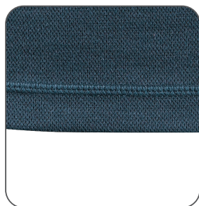
ploché švy ploché švy flat seams płaskie szwy