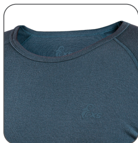
okrouhlý výstřih okrúhly výstrih round neckline okrągły dekolt