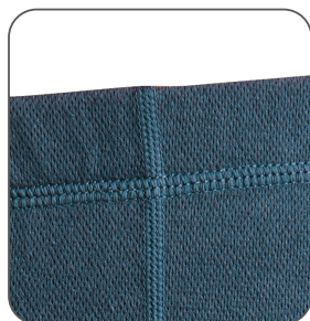
ploché švy ploché švy flat seams płaskie szwy