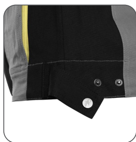
regulace v pase regulácia v páse adjustable waist regulowany pas