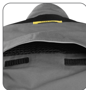
ventilace na zádech vetranie na zadnej strane ventilation on the back wentylacja z tyłu