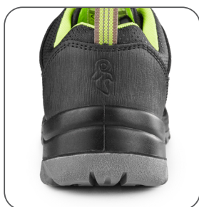
odolná pätná časť odolná päťová časť resistant heel part wytrzymała część pięty