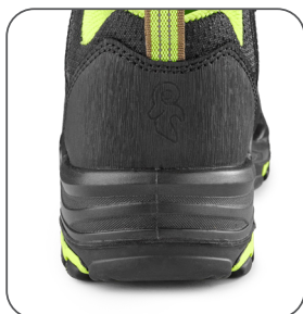
odolná patní část odolná päťová časť resistant heel part wytrzymała część pięty