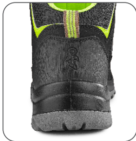
odolná patní část odolná päťová časť resistant heel part wytrzymała część pięty