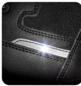
detail reflexního pásku detail reflexného pásika reflective strip detail detal odblaskowego paska