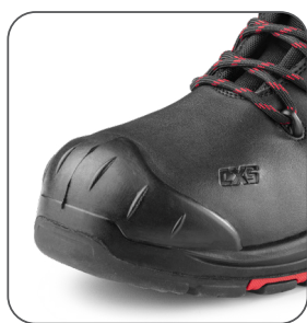
zesílená přední část proti okopu vonkajšia ochrana špičky reinforced PU overcap nosek z PU wzmocnieniem