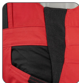
pruženka v bocích guma v bokoch elastic in the hips elastyczna gumka po bokach