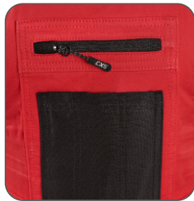
náprsní kapsy náprsné vrecká chest pockets kieszenie na piersi