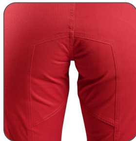
zesílený sed zosilnený sed reinforced seat spodnie w kroku są wzmocnione