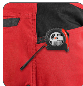
kapsa s vyztužením pro zavěšení metru vrecko s výstužou na zavesenie metra pocket with reinforcement for hanging a measuring tape kieszeń z wzmocnieniem do zawieszenia miarki