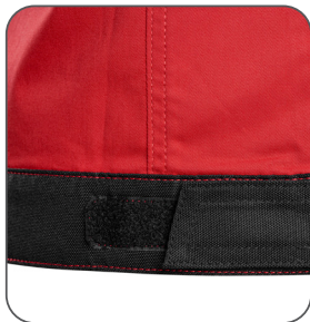
regulace v pase regulácia v páse adjustable waist regulowany pas