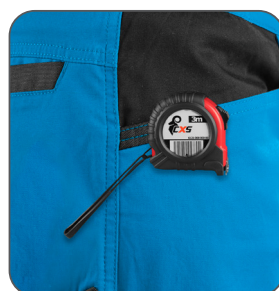
kapsa s vyztužením pro zavěšení metru vrecko s výstužou na zavesenie metra pocket with reinforcement for hanging a measuring tape kieszeń ze wzmocnieniem do zawieszenia miarki