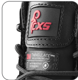
3M Thinsulate izolace 3M Thinsulate izolácia 3M Thinsulate insulation izolacja 3M Thinsulate