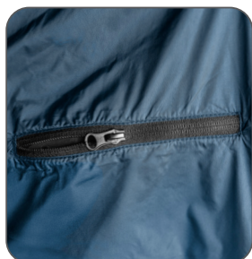
vnitřní náprsní kapsa na zip vnútorné náprsné vrecko na zips inner chest zip pocket wewnętrzna kieszeń piersiowa na zamek