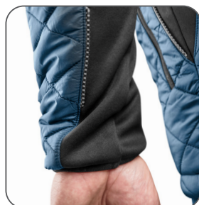
rukávy do gumičky rukávy do gumičky elasticated cuffs rękawy zakończone gumką