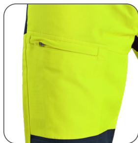
boční kapsa side pocket boczna kieszeń