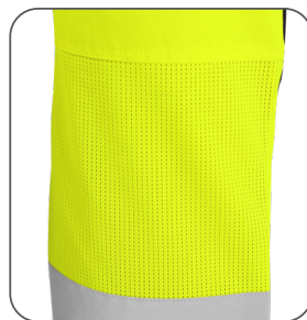
síťovina v zadní kolenní části mesh back knee part siatka z tyłu kolana