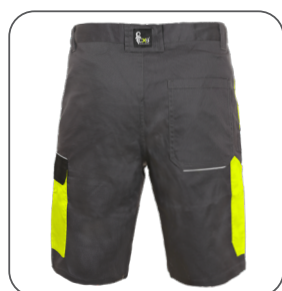
zadní strana back side z tyłu