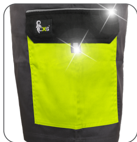
boční kapsa s klopou side flap pocket kieszeń boczna z patką