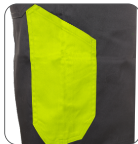
kapsa na skládací/svinovací metr tape/folding measure pocket kieszeń metr taśmowy / składany