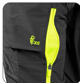
ventilace na stehně ventilácia na stehne thigh ventilation wentylacja na nogawce