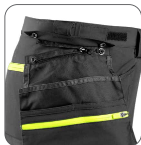
odepinací kapsy odnímateľné vrecká detachable pockets odpinane kieszenie