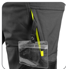
stehenná kapsa s vnútorným pouzdom na ID kartu stehenné vrecko s vnútorným držiakom na ID kartu thigh pocket with inner ID card holder kieszeń na udzie z miejscem na ID kartę