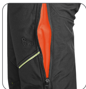
ventilace na stehně thigh ventilation wentylacja na nogawce