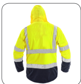
zadní strana back side odwrotna strona