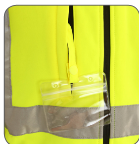
poutko pro ID kartu ID holder uchwyt karty identyfikacyjnej