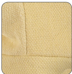
aramidová tkanina aramid cloth włóknina aramidowa