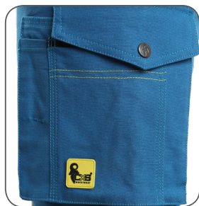
multifunkční kapsa multifunctional pocket kieszeń wielofunkcyjna