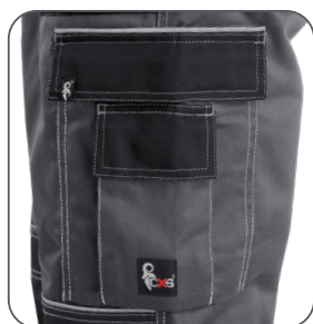
multifunkční kapsy multifunctional pockets kieszenie wielofunkcyjne