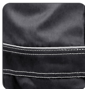
reflexní doplňky reflective accessories elementy odbłaskowe