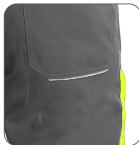
reflexní doplňky reflective accessories elementy odbłaskowe