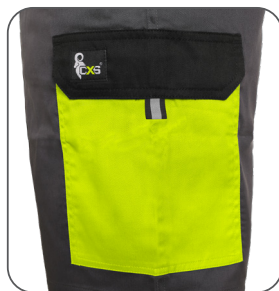
boční kapsa s klopou side flap pocket kieszeń boczna z patką