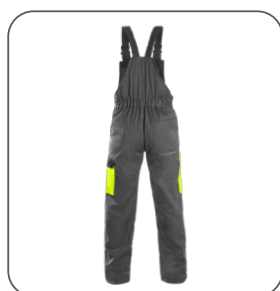
zadní strana back side z tyłu