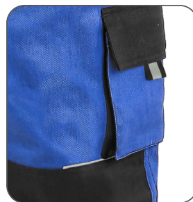
reflexní doplňky reflective accessories elementy odblaskowe