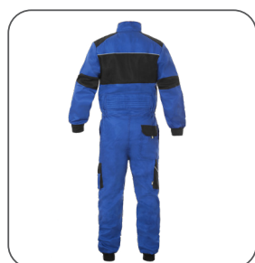
zadní strana back side z tyłu