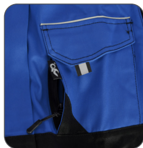
skrytá náprsní kapsa hidden chest pocket ukryta kieszeń na piersi