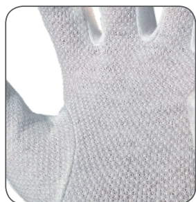
PVC terčíky PVC dots PVC kropki